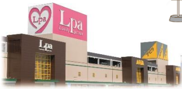
アピタ・エルパ前