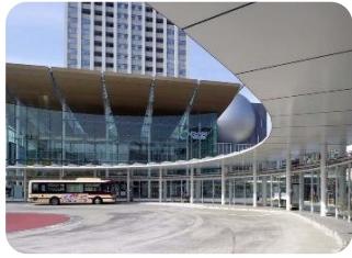
福井駅前1番のりば