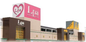
アピタ・エルパ前